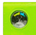
Memiliki lampu indikator