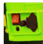
Regulator pengatur kecepatan