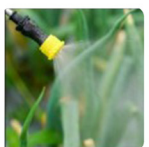
Daya semprot kencang